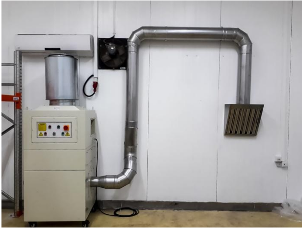
משולב עם מנדף סדק מדגם Cross-flow