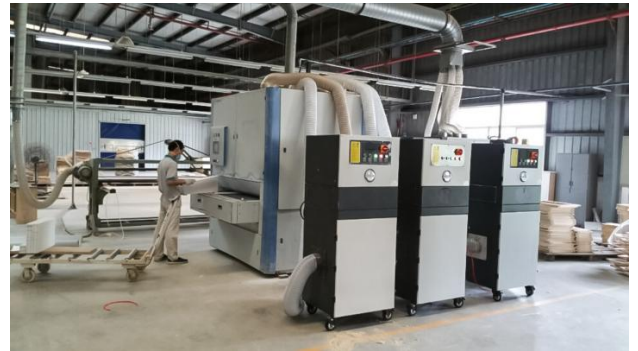
שאיבה ישירה ממכונות ליטוש עץ