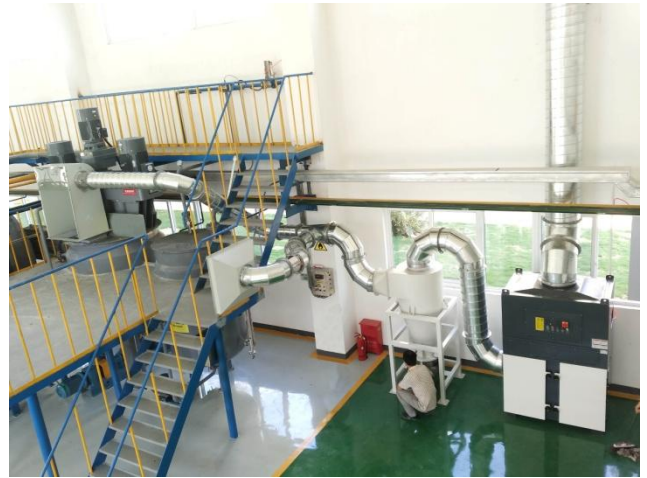
שאיבה מעמדות שפיכה